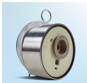
Figura 1: Vedere frontală a vechiului model